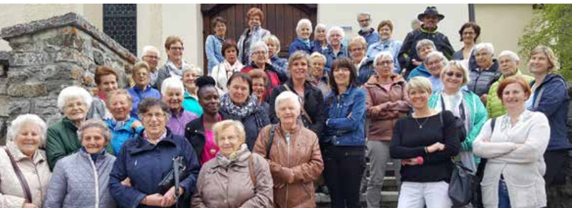
Senioren von Pfunds bei der Wallfahrt 2017 nach Galtür.

Diese jungen Damen und Herrn freuen sich schon auf