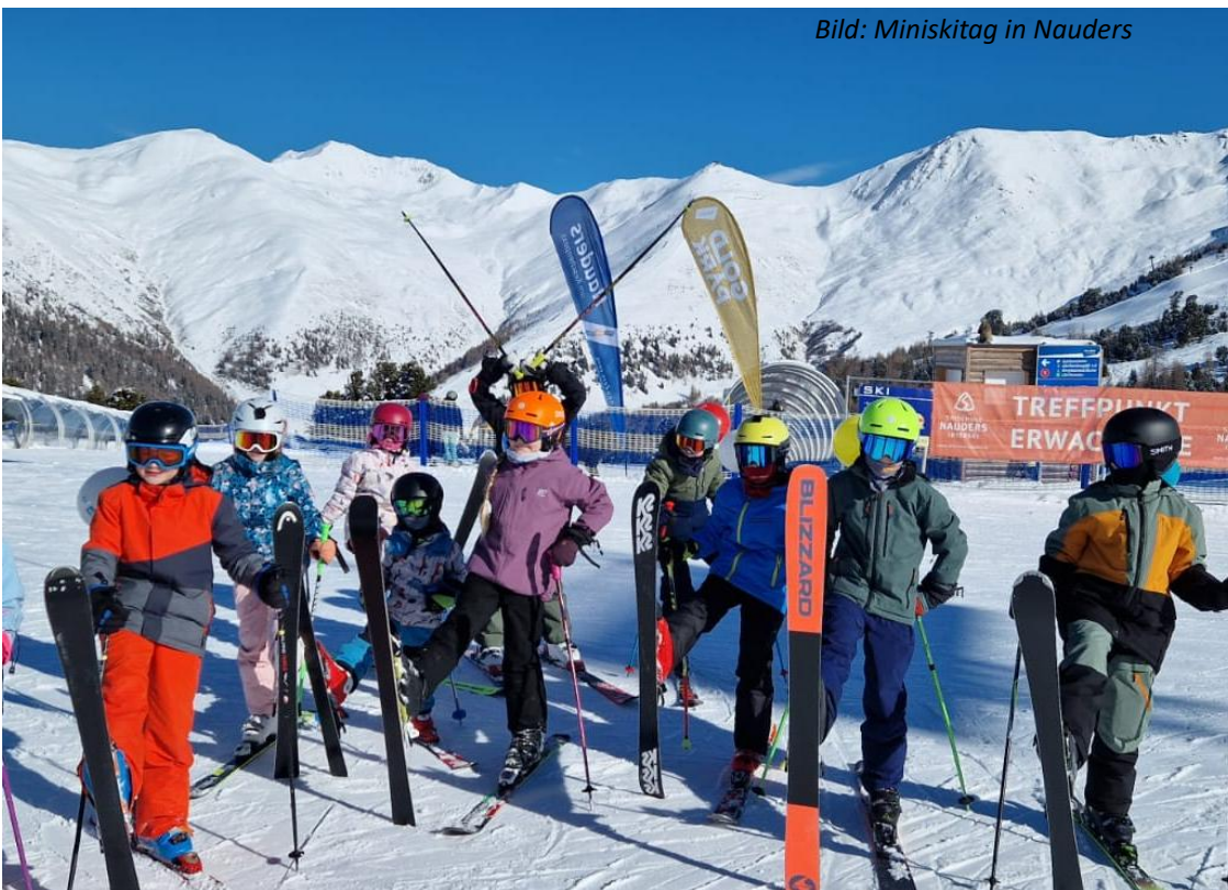
Bild: Miniskitag in Nauders

für die Pfarren Fließ & Hochgallmigg, Kaplanei Piller und die Fraktionen Eichholz, Niedergallmigg & Urgen