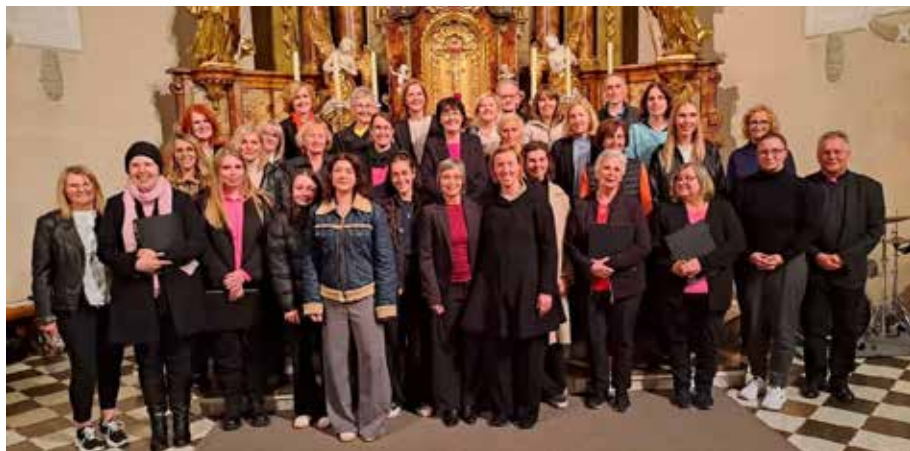
Projektchor der LMS Landeck mit Band