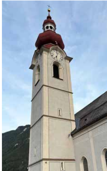
Kirchturm Pfarrkirche Pfunds