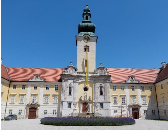
Benediktinerstift Seitenstetten, Niederösterreich