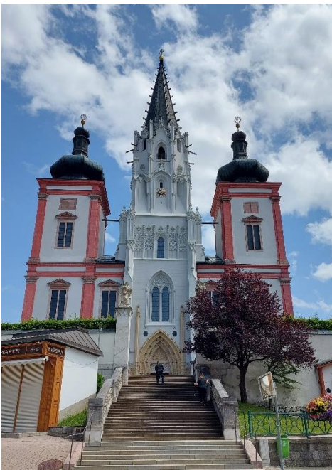
Basilika Mariazell, Steiermark