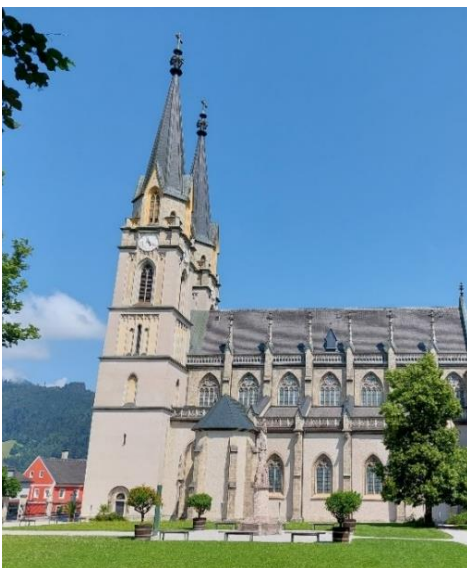
Benediktinerstift Admont, Steiermark