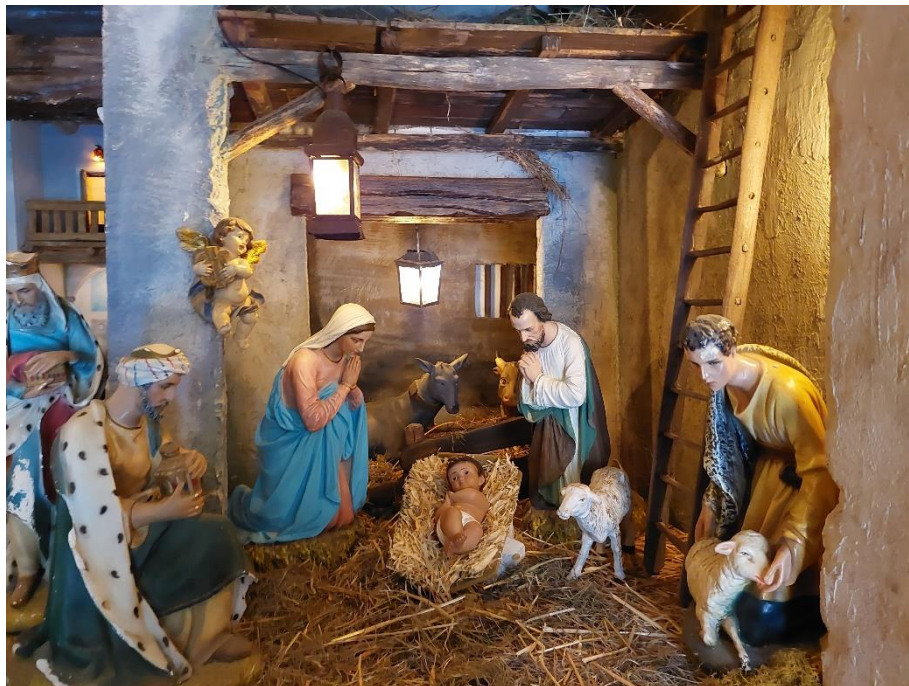
Krippe im Museum von Madonna del Frassino, am südl. Ende des Gardasees

Herausgeber: Seelsorgeraum Serfaus-Fiss-Ladis