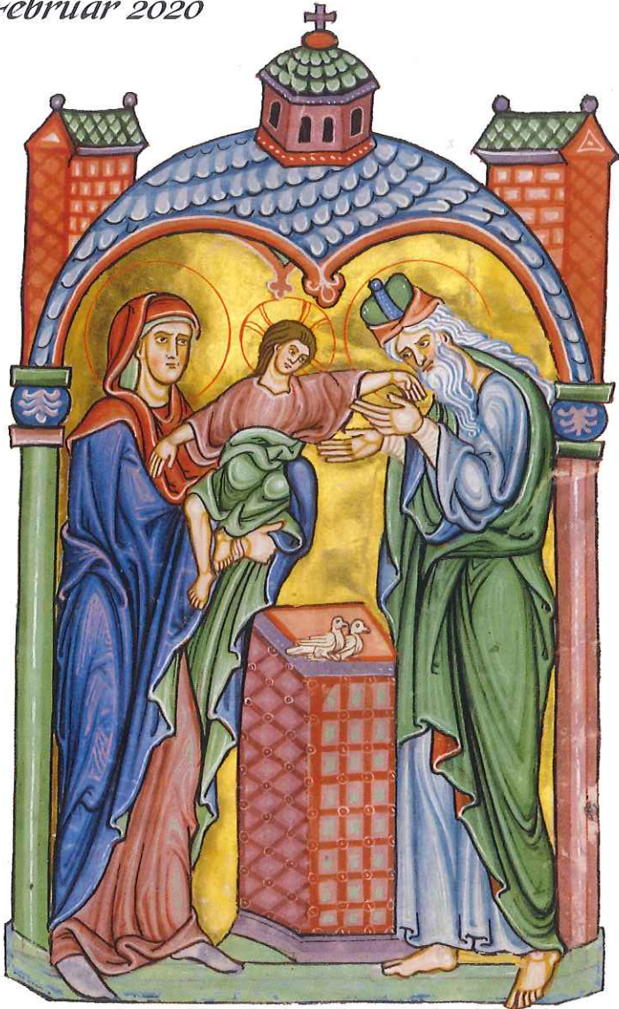
2. Februar - Darstellung des Herrn Bamberger Psalter