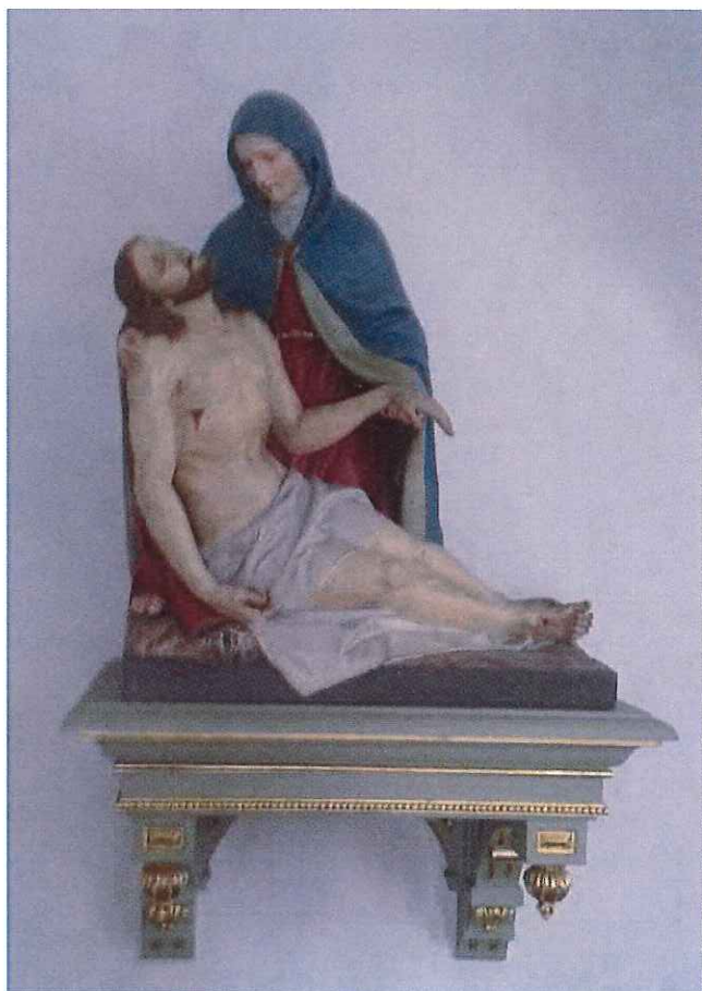
Pieta, Maafskirche, Fließ