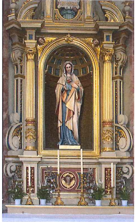
Marienaltar in der Barbarikirche

Denn, so heißt es in einem Lied, wo die Güte und die Liebe wohnt, dort nur wohnt der Herr.