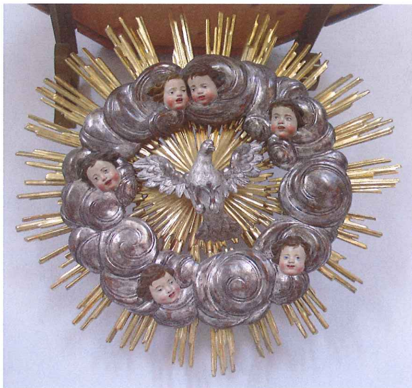
Darstellung des Hl. Geistes als Taube Maafskirche Fließ